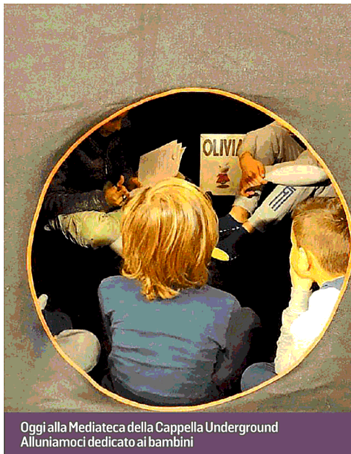
Oggi alla Mediateca della Cappella Underground Alluniamoci dedicato ai bambini

rà una telefonata!). Oggi alle 16, la Mediateca della Cappella Underground (via Roma 19) propone Alluniamoci! con i formatori della Mediateca. Un modo bizzarro di mettere il naso nella luna tra piccole letture e piccole visioni! La luna è come una torta: ma non una qualunque, la più ricca e golosa e nessuno può rinunciarci. Si ripercorreranno le vicende di alcuni personaggi protagonisti di letture e film. L'attività prevede la lettura di un brano del libro scritto da Jules Verne "Dalla terra alla luna" in particolare quello riferito all'allunaggio e la visione di uno o due contributi video, tra cui