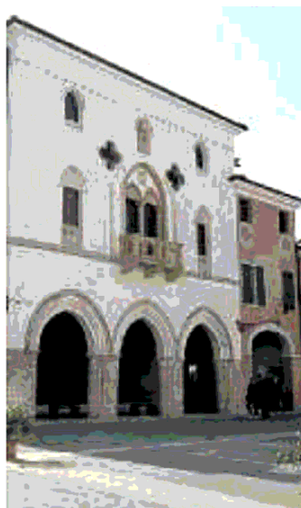
TEATRO Il seicentesco Arrigoni in piazza a San Vito