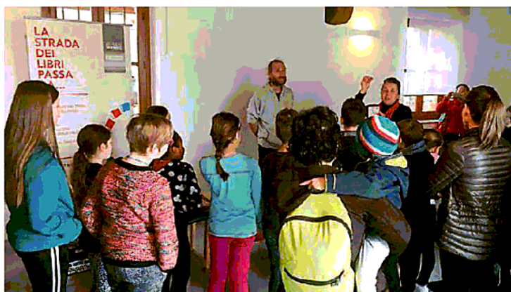
Uno degli appuntamenti della tre giorni

"La strada dei libri passa da..." nasce da un'idea di Damatrà Onlus che ha favorito la messa in rete di tantissime real-