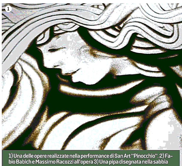
1) Una delle opere realizzate nella performance di San Art "Pinocchio". 2) Fabio Babich e Massimo Racozzi all'opera 3) Una pipa disegnata nella sabbia